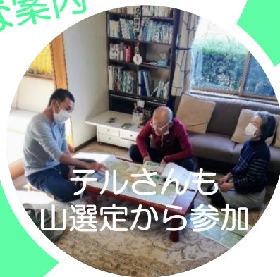
テルさんも 山選定から参加